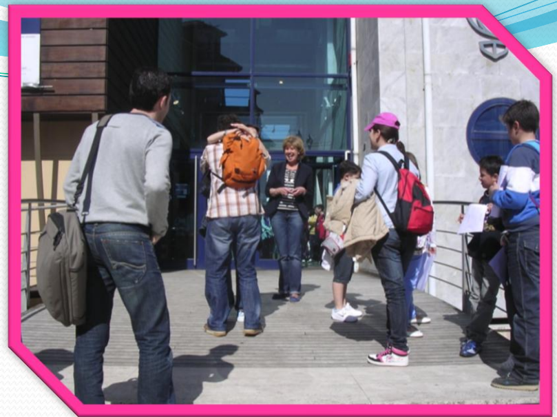
Dos profes que se reencuentran y se abrazan