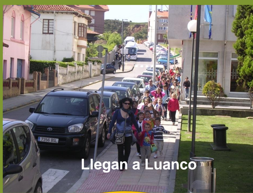
Llegan a Luanco