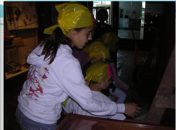
Los piratas amarillos y sus guías