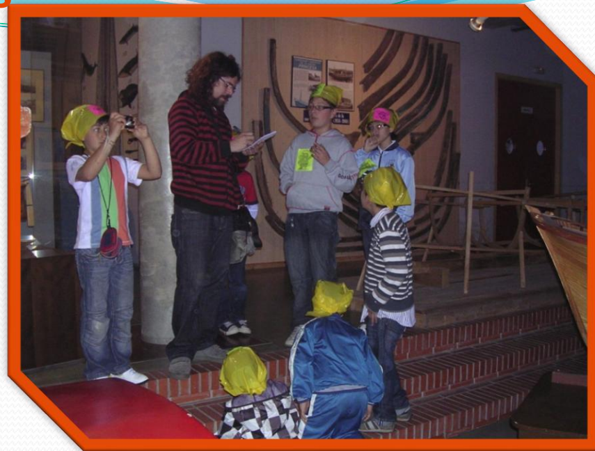
Atendiendo a la prensa