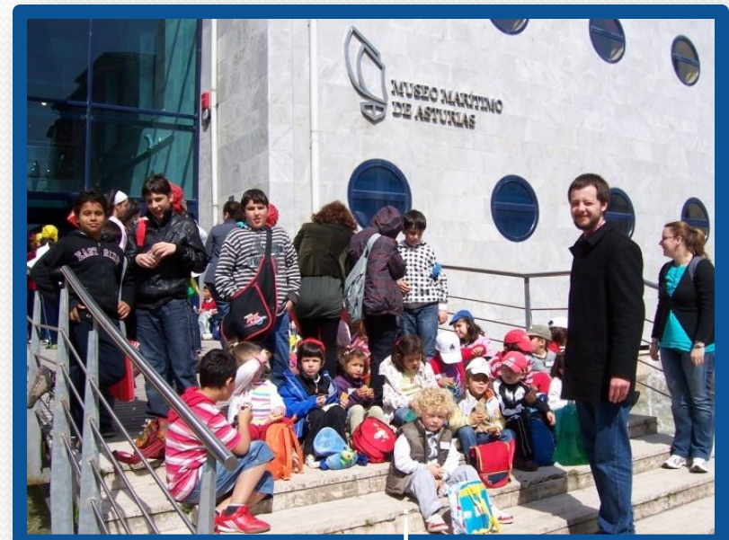
Y un descanso