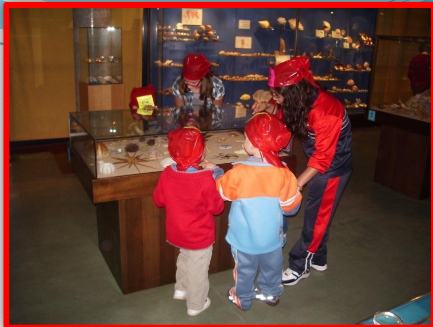
Los piratas rojos con sus guías